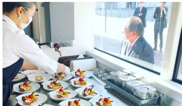
2020.11~2年連続開催 若狭路レストランバス