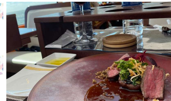
2019.3~3年連続開催 東三河レストランバス