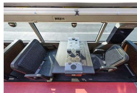
3名テーブル (イメージ)