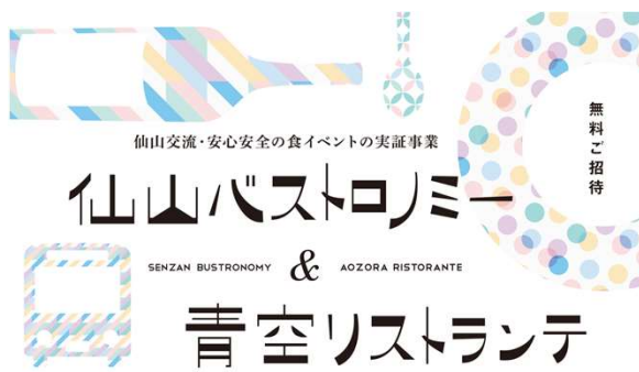
2020.12 仙山バストロノミー & 青空レストランテ