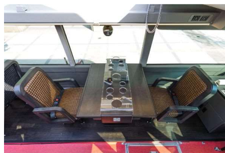
2名テーブル (イメージ)