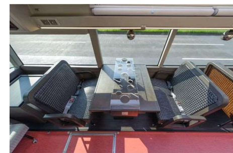
4名テーブル (イメージ)