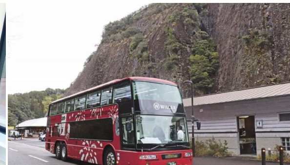
2021.2 和歌山初運行 熊野ジビエレストランバス